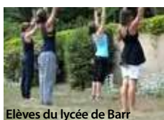
Elèves du lycée de Barr

Cet enseignement se situe au croisement du champ artistique et de l'EPS. Il valorise la dimension poétique du