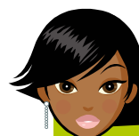
Élève de terminale ES, spécialité sciences politiques

« Cette filière est diversifiée grâce aux sciences économiques et sociales avec notamment la sociologie, l'économie et l'histoire-géographie. Ces matières intéressantes nous aident à comprendre la société dans laquelle on vit. Il faut travailler beaucoup et s'investir dans son travail pour progresser et y arriver. J'ai appris à suivre régulièrement les actualités ce qui m'a apporté une ouverture sur le monde. Un conseil, foncez, mais accrochez-vous pour réussir ! »