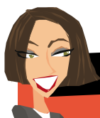
Mme Seidendorf, professeur de SES

« En SES , les élèves apprécient de comprendre enfin les enjeux de l'actualité, de maîtriser des notions dont ils entendent parler tous les jours dans les médias. C'est donc l'aspect concret et l'appui sur des supports variés (vidéos, articles...) qui les motivent le plus. »